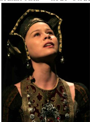
Vass Teri a Lear királyban

Adott egy igazi melós, több gyerekes, lakótelepi családból származó gyerek, egy szép kisleány, aki már alsós tanu-