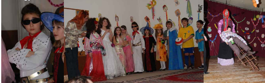
Somogyi Rezső Általános Iskola