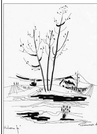
Szabados István: Három fa