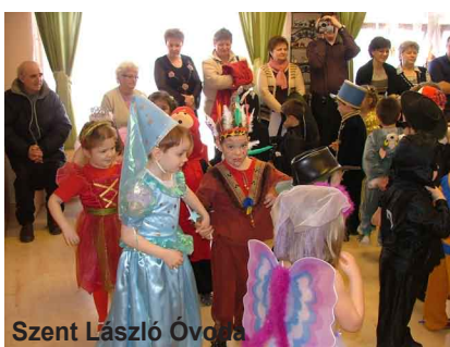
Szent László Óvoda

Február a farsang időszaka. A város oktatási intézményeiben egymást érik a farsangi mulatságok. A gyerekek és a szülők igen változatos jelmezeket készítettek. A vidám műsorszámok és a jelmezes felvonulás után pedig a finomságok elfogyasztása és a közös multság következett.