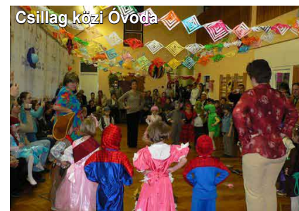
Csillag közti Óvoda

Február a farsang időszaka. A város oktatási intézményeiben egymást érik a farsangi mulatságok. A gyerekek és a szülők igen változatos jelmezeket készítettek. A vidám műsorszámok és a jelmezes felvonulás után pedig a finomságok elfogyasztása és a közös multság következett.