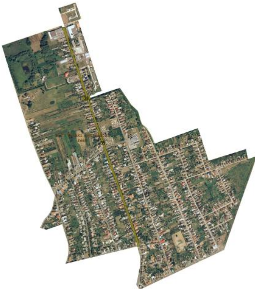
1. kép: a projekt akcióterülete

Ebben a városrészben kiemelkedő a lakófunkció jelenléte. A szociális városrehabilitációs beavatkozások fókuszában ebből adódóan az olyan funkciók fejlesztése áll, amelyek a területen élők életkörülményeinek javítását, társadalmi beilleszkedését segítik elő.