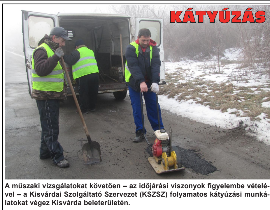
A műszaki vizsgálatokat követően – az időjárás viszonyok figyelembe vételével – a Kisvárdai Szolgáltató Szervezet (KSZSZ) folyamatos kátyúzási munkálatokat végez Kisvárdai belterületén.