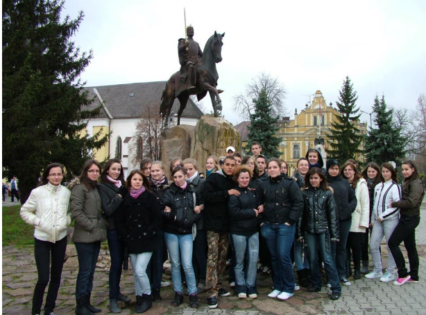
A jelenlegi Arany-programosok egy csoportja ismerkedik Kisvárdai nevezetességeivel