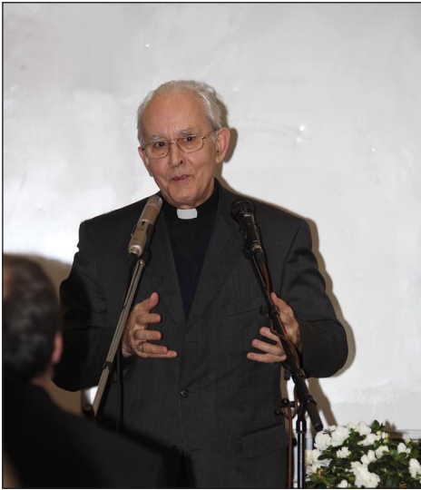
Bosák Nándor püspök

Egyházmegyénk négy helyszínen indította különleges akadémiáját a 2011-re meghirdetett Család évébe kapcsolódóan. Kisvárdára az esperesi kerületből papjaikkal együtt érkeztek az érdeklődő hívek 2011. február 5-én, hogy hiteles előadók segítségével