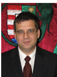
Dr. Seszták Miklós országgyűlési- és önkormányzati képviselő Tel: 30/953-4130 E-mail: sesztak@internet.hu