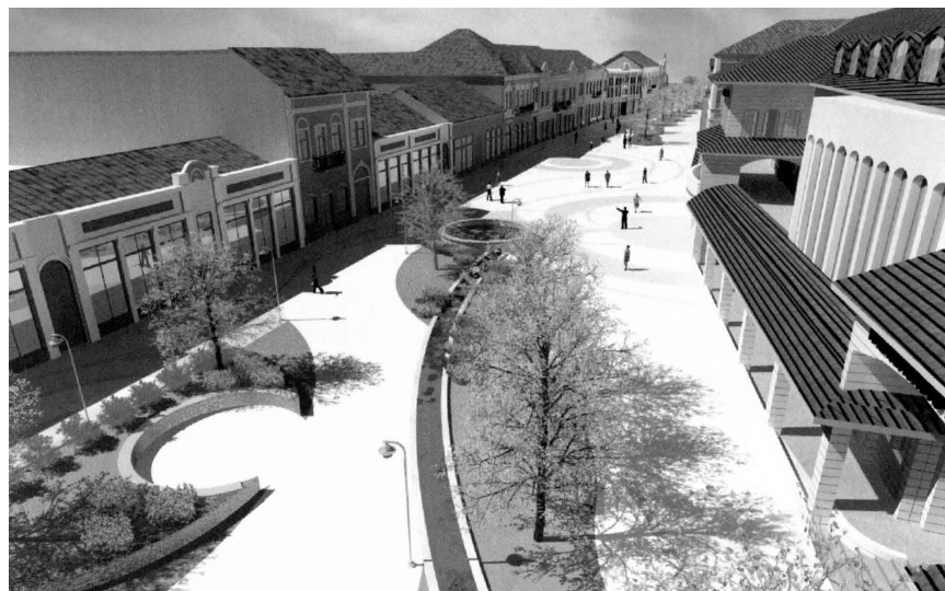
A Szent László utca látképe

Közvetlen célcsoportot jelentenek az akcióterületen élő lakók, akiknek a lakókörnyezete megújul. Ide sorolhatók a városközpontban működő vállalkozások, hiszen a vonzó városközpont az ő forgalmukat növeli. A belváros jobb megközelíthetősége, a súlyos parkolási problémák részleges enyhítése javítja az itt működő hivatalok, kulturális- és közintézmények látogatottságát. Mindezek következtében célcso-