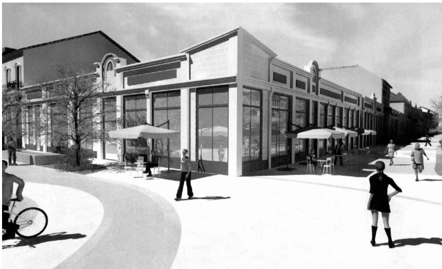
A Sarok Kávéház látványterve

A gazdasági funkció erősítéséhez kapcsolódva megújul a Sarok Kávéház is, mivel a tulajdonos is csatlakozott a pályázathoz a szükséges önerő vállalásával.