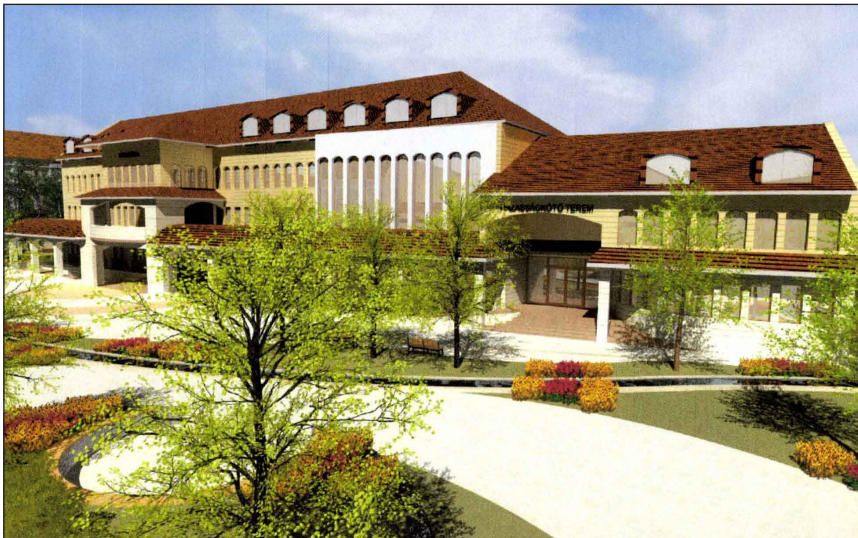
A Városháza és az új konferenciaközpont látványterve

Kisvárdai önkormányzata az elmúlt években kétszer nyújtott be pályázatot az Észak-Alföldi Regionális Fejlesztési Tanácshoz a városközpont rehabilitációjára. Az akkor benyújtott pályázatok forráshiány miatt elutasításra kerültek. Az elmúlt év októberében ismét beadta az önkormányzat a pályázatot a „ Funkcióbővítő integrált települési fejlesztések ” címmel meghirdetett felhívásra. A projektösszköltsége 1.269.638.589,-