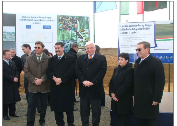
A beruházás kezdete 2008 márciusában

polgármesteri tisztséget az utak-járdák, közművek kiépítésének sürgetése mellett az egyik legfontosabb feladatnak a választói gyűléseken és lakossági fórumokon a szeméttelép bezárását és új korszerű hulladéklerakó építését jelölték meg. Arra is jól emlékszem, hogy mit jelentett a környéken élőknek 20 évvel ezelőtt a szeméttelép. Persze erről manapság szokás elfeledkezni, pedig a szemét