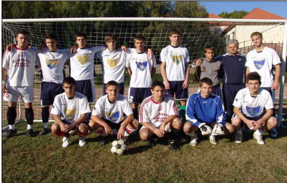
A házigazdák focicsapata

Október 5-én rendezték meg a Besi Kupát a Bessenyei György Gimnáziumban. A verseny célja, hogy a már meglévő jó kapcsolatokat ápolják a határon túli és a hazai iskolákkal, és persze versenyzési lehetőséget is teremtsenek a közeli középiskolásoknak.