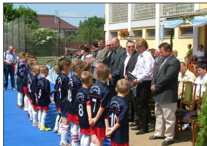
A jelenlegi és az egykori focisták