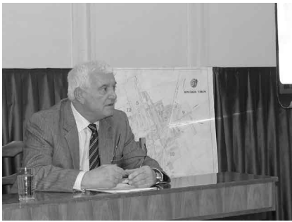
Dr. Oláh Albert polgármester

A Támogatási szerződés megköté- sét követően az első lépés a projekt- menedzsment szervezet felállítása volt, amely a projekt megvalósítási szakaszában kiegészül a közbeszer- zésen kiválasztott külső szakér- tőkkel. Ezt követően történt meg a közbeszerzések lebonyolítása az előkészítő szakasz tevékenységeire, mely tervezési és PR feladatokból állt. A Támogatási szerződés érte- lében Részletes megvalósíthatósági tanulmányt szükséges benyújtani a Közreműködő Szervezet felé vé- leményezésre és a kiválasztott mű- szakai változat jóváhagyására, hogy