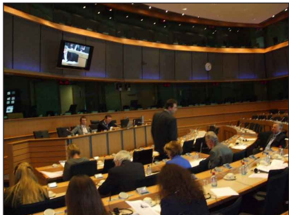
A vendégek közvetlen közelről megfigyelhették a Brüsszelben folyó munkát

Délután, hazautazásunk előtt rövid városnézésen vettünk részt. Kis csapatunk „Európa fővárosában” eddig csak a brüsszeli főteret, a Grand-Place-t