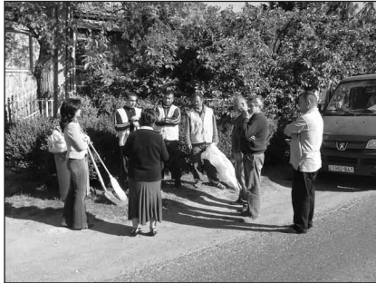
Megbeszélés az egyik köztisztasági brigád tagjaival

Az ez évi foglalkoztatás létszámában és feladatvállalásában lényegesen nagyobb horderejű. Ez a változás lényegében a szociális törvény módosításából ered, mely alapján a mun-