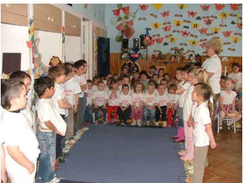
A csoportok bemutatkozása

A Csillag-közi Központi Társulási Óvoda Tompos Lakótelepi Tagintézményében évek óta Hagyományőrző Hetet rendeznek. Ebben az évben április 14-17. között került sor a változatos programokra.