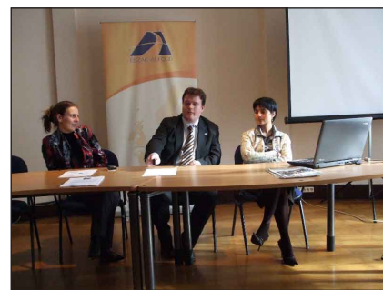
Az Észak Alföldi Régió Brüsszeli Képviseletének munkatársai

Csodálatos élmény volt eljutni az Európai Unió Parlamentjébe. Nyitott szemmel és nyitott szívvel léptünk be mindenhová. Elmondhatjuk: „Az emberi mű nagy összjáték. Sorsod a tied, te csi-