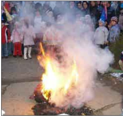
Az óvodások elűzik a telet a kiszébbot elégetésével

A III-IV. korcsoportos fiúk a szerenkénti versenyben, ugráson, gyűrűn IV. helyezést értek el, a csapatban IV. helyezést.