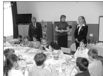
A programok végén vendégül látták a leendő iskolásokat