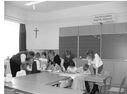
Tavaszi képeket készítettek a gyerekek a tanító nénekkel

Tudjuk jól, hogy a gyermekek önálló munkáját, alkotásuk örömét, képzeletüket még igazi, felhőtlen boldogság hatja át. Mindezeket mi együtt élhettük át a szülőkkel, s ennél jobbat-szebbet ki is kívánhatna cseperedő gyermekének-gyermekeinek?