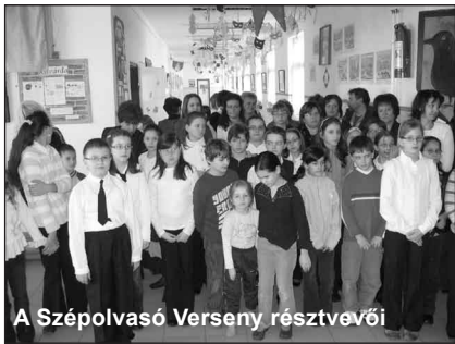
A Szépolvasó Verseny résztvevői

Az eredmények a www.mppki.hu honlapon megtekinthetők, a versenyző iskolák emailben kaptak tájékoztatást.