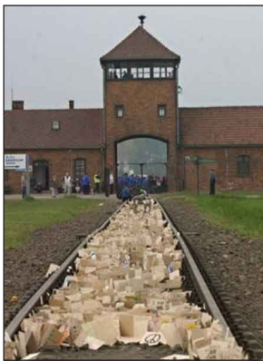
Emléktáblák a sínek között

A csapat tagjai a döntőn riport formájában osztották meg a zsűrivel és társaikkal az Élet Menetén átélt érzelmeiket. Tanítványaim mély empátiával rendkívüli módon érezték meg a haláltábor azon sajátosságát, hogy arctalanná, névtelenné, hontalanná tette áldozatait. Ugyanakkor egyedülálló módon emelték be riportjukba, hogyan elevenednek meg az „arctalan” arcok a Kanada részleg Szauna épületében kiállított, bőröndökből előkerült fényképek által. A bicikliző kisfiúk, az édesanyjukhoz simuló, babájukat ölelő kislányok, az esküvői képek boldog párjai, a közös családi fotóra szépen felöltözött családtagok élettel teli ragyogása itt ért véget. Egyszerre sokkolt és tett kíván-