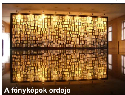
A fényképek erdeje