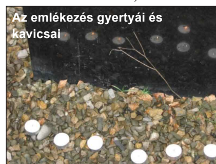
Az emlékezés gyertyái és kavicsai

A Bessenyei György Gimnázium és Kollégium csapata, mely a döntőn rendkívüli teljesítménnyel első helyezést ért el, Tatabánya Város Önkormányzata – a verseny egyik támogatója – jóvoltából négy napos, élményekben gazdag kiránduláson vehetett részt jutalomként, október elején Krakkóban