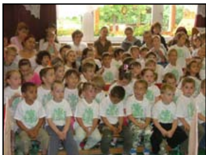
A Holle anyó közössége

Június 4-én a sporté volt a főszerep. Közös bemelegítés után, a gyermekek pon-ponos bemutatója következett, majd szülő-gyermek vetélkedőjén szurkolhattunk a csapatoknak.