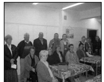
A fórum résztvevői

Tájékoztatást nyújtott szociális támogatási lehetőségekről, a 2008. január óta bevezetett új, rokkantak munkába állását segítő rehabilitációs járadék szabályairól. A közgyűlésen résztvevők külön napirendi pontként elmondták véleményüket, megvitatták a fennálló problémákat. A polgártársak részéről a legnagyobb hangsúlyt a 2006. évben elvégzett szennyvízhálózat kiépítéssel kapcsolatos kritika kapta. A Tátra út szennyvízhálózat kiépítés kapcsán, a helyreállítási munka során elvégzett aszfaltozás minőségére panasz van. Mind-