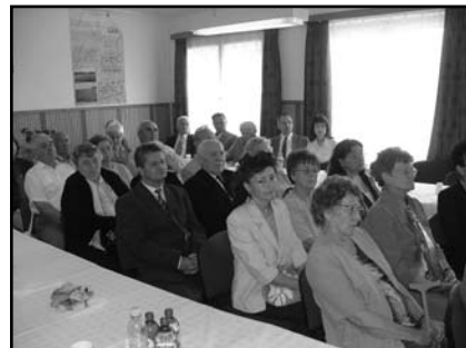
Az ünnepségen résztvevők egy csoportja

na fajták nemesítésénél is génforrásként használják Teichmann fajtáit.