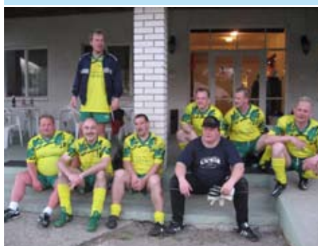
A vendég csapat a barátságos mérkőzés után

A közelmúltban Kisvárdán járt a németországi testvérváros, Hildburghausen küldöttsége.