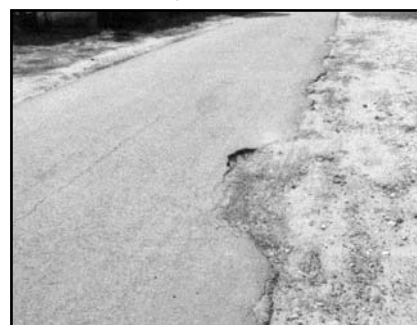
A Tátra utca aszfaltja