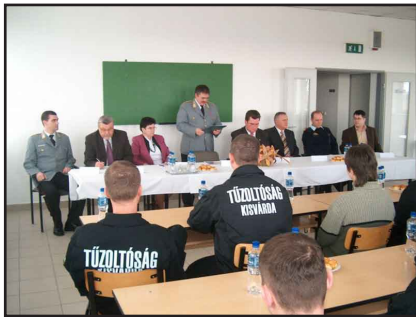
Az értekezlet résztvevői

Hagyomány a rendvédelmi szerveknél - így a Kisvárdai Tűzoltóságnál is - hogy évente értékelésre kerül az elmúlt időszakban végzett tevékenység, levonva annak tapasztalatait, meghatározva az előttük álló feladatokat.