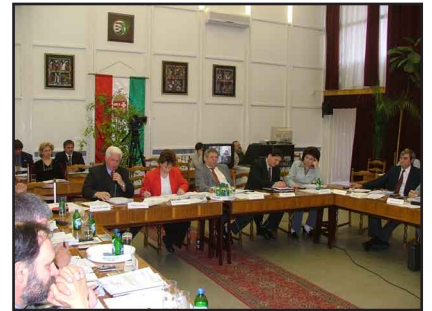
Sok kérdést tettek fel a képviselők a távhőszolgáltatással kapcsolatban

tése. Vannak még vitatott kérdések (pl. a Kisvárdát elkerülő út építése), de a mostani lerakót 2009. július 15-ig be kell zárni.