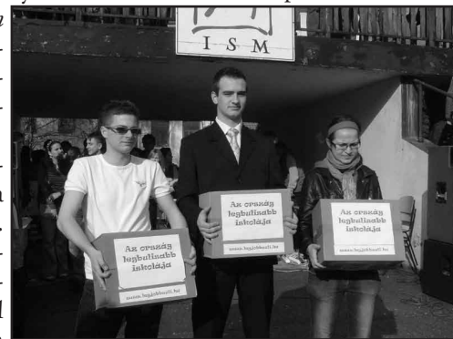
A három igazgató-jelölt

a napon ezt bizonyíthatták is, hiszen a vidám versenyek, látványos bemutatók, a közös sütés-főzés után igazi besis buli zárta a napot.