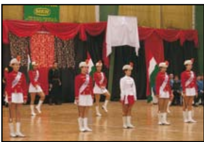
A nyitókép részlete

A MISTRÁL Ifjúsági Sport Egyesület, a Nimród Gyermekei Íjász Hagyományörző Baráti Kör, a Kisvárdai Fafaragók, és az Alsócsernátoni Haszmann Pál Falumúzeum közös szervezésében került sor a „RÉTKÖZTŐL-HÁROMSZÉKIG” elnevezésű hagyományteremtő rendezvényre 2008. február 15-16-án a Kisvárdai Városi Tornacsarnokban.