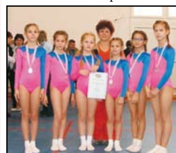
I-II. korcsoportos lányok

Az V-VI. korcsoportban a Bessenyei György Gimnázium csapata 2. helyezést ért el.