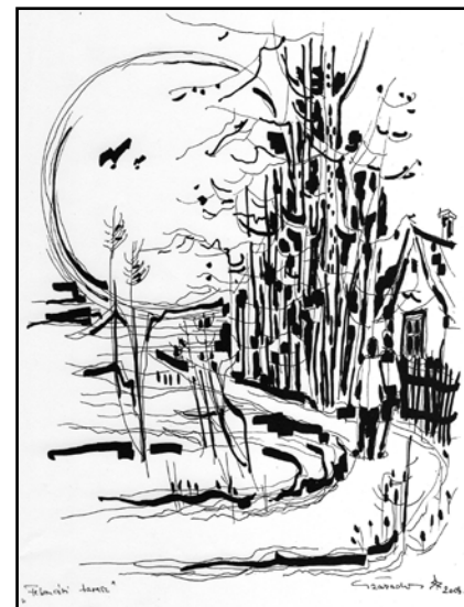
Szabados István: Februári tavasz