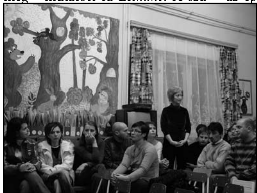
A szülők kezdeményezték a fórumot