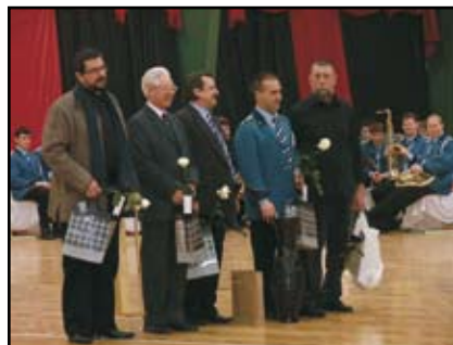
A székelyföldi küldöttség vezetői

A második nap délelőttjén a fafaragás rejtelmibe kaphattak betekintést