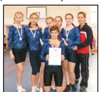
III-IV. korcsoportos lányok