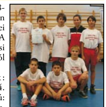
III-IV. korcsoportos fiúk

Egyéni eredmények: Gyüre Aliz 3. hely, Korbács Alexandra 4. hely, Szónok Viktória 6. hely.