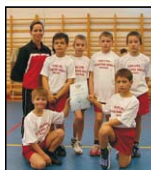
I-II. korcsoportos fiúk

kcs. lány: 2. hely. Várday István tagintézmény csapata: 3. hely. Egyéni eredmények: Balogh Zsakin 3. hely, Török Fanni 5. hely.