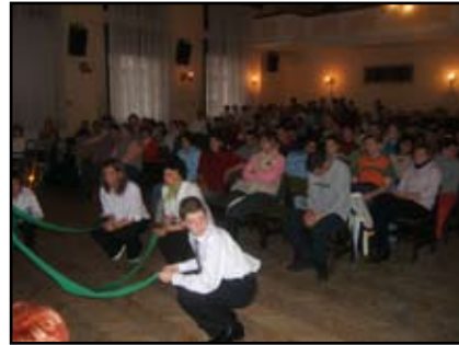
Fellépés Nyíregyházán a Kölyökvárban...

MOL Gyermekgyógyító Program a Sérült Gyermekekért Alapítvány javára