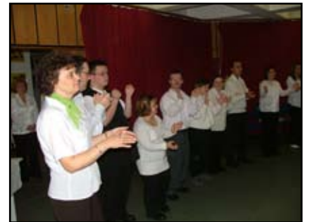
... és Kisvárdán a Művészetek Házában

A közeljövőben megkezdjük a felkészülést a tavaszra tervezett jótékonysági gálánkra.