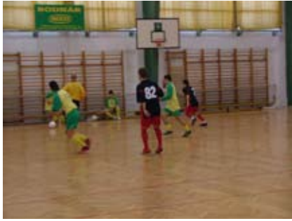
A pályán izgalmas összecsapásokat láthatott a közönség