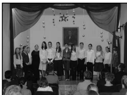
A zeneiskola növendékei a karácsonyi hangversenyen is izelítőt adtak tehetségükből

Harmadik alkalommal rendezte meg a Ferenczy György Alapítvány Budapesten az Országos Ferenczy György Zeneiskolai Zongoraversenyt. A versenyt a Lengyel Köztársaság Nagykövetsége is támogatta.