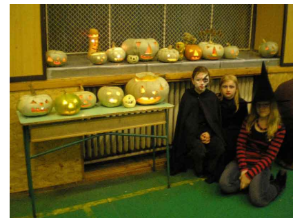
Az angolszász hagyományokat elevezték fel a Halloween Party-n

2008. január 19-én a PARISH BULL Konferencia termében szervezi az SZMK a hagyományos SZÜLŐK BÁL-JÁT. A jótékonysági bál bevételét az udvari játékok cseréjére és bővítésére fogjuk fordítani.