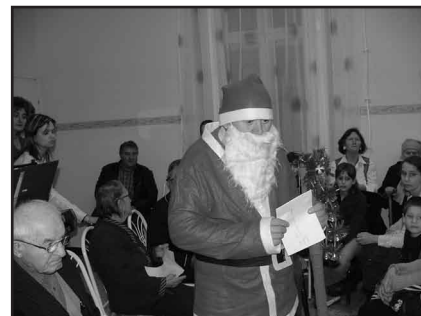
Az idős emberek szép műsort adtak