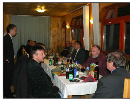
A sajtótájékoztatót részt vettek a versenyző támogatói

Az idényt azonban már másik, szokatlan autóval, egy Peugeot 205-tel folytatta. A versenyek voltak egyben az edzések is, ahol csiszolták a beállításokat, próbálgatták a gépet. A Trabant lecserélése amúgy is tervbe volt véve, (mint Zoltán elmondta a Trabant közönség-kedvencnek jó volt, de szükség volt egy erősebb, jobb autóra!) de nem ilyen módon és áron. A mostani autó is csak egy lépés, mert a jövő évben még ennél is komolyabb építésű Peugeot-val kíván elindulni, amihez szükség van a támogatók segítségére. A rallycross-ban, mint minden technikai sportágban hatalmas összegeket lehet (és kell is) elkölteni. Akiknek köszönöm a élményekben gazdag