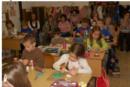
A gyerekek karácsonyi díszeket készítettek a bemutató órán

A jól sikerült bemutató órák után rendkívül hasznos tapasztalatcsere került sor az óvónők és tanítónők között. Együttműködési szerződésük elkövetkező feladatainak megbeszélésével zárult a nap.