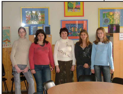
Az országos második helyezett csapat és felkészítő tanáruk

A verseny résztvevői: A versenyen azonos iskolába járó 3-8. osztályos tanulók évfolyamonként szerveződő 4 fős csapatai vehetnek részt (egy iskolából akárhány csapat indulhat). A 3-6. osztályosok egy-egy, a 7. és 8. osztályosok két-két kategóriában versenyeztek aszerint, hogy általános iskolai vagy gimnáziumi osztályba járnak. A nevezéskor minden csapatnak