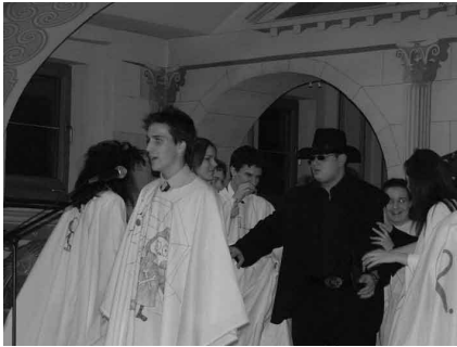
Az egyik jelenet részlete

A képzésben jelenleg résztvevő hajdúböszörményi és kisvárdai csoportok műsora, majd a fogadáson kínált hálaadási finomságok - a lelkes közönség nagy megelégedésére - sikeresen jelenítették meg a tradicionális amerikai ünnep hangulatát.