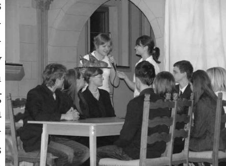
Izélítő az amerikai hagyományokból