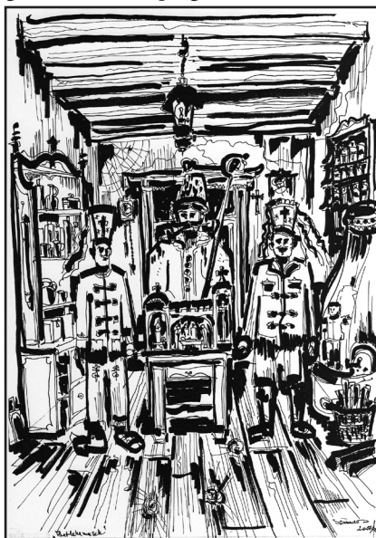
Szabados István: Betlehemesek

Ez a cikk azért született, mert a FIKISZ! szeretné elérni, hogy Kisvárdai egyik leghíresebb, leghíresebb polgára a város díszpolgára lehessen.