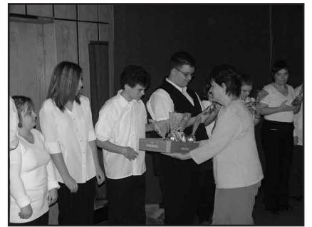
A klub tagjai ajándécsomaggal köszönték meg az előadást

Ezt követően a Városi Bölcsőde és Rehabilitációs Napközi Otthon Napsugár Színjátszó csoportja tartott meghatározó előadást, felelevenítve a karácsonyi szokások eredetét. A Somogyi Rezső Általános Iskola diákjai is szép műsorral kedveskedtek a klubtagoknak.