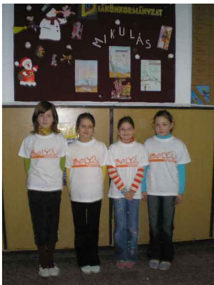
A megyei harmadik helyezett matematikos csapat