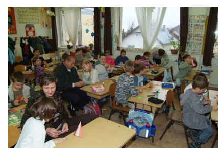
A szülők is bekapcsolódtak az órai munkába

December elején pedig az első-második osztályosok szülei tekinthették meg az órákon, hogy gyermekük mennyire tudott megbirkózni az iskolakezdés nehézségeivel. A gyerekek és szülei közösen is tevékenykedtek a technika órákon.