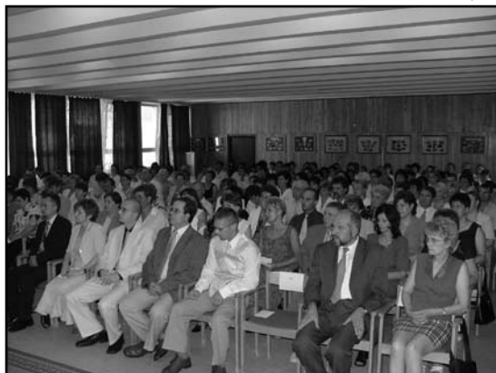
A kórház dolgozói és a meghívott vendégek