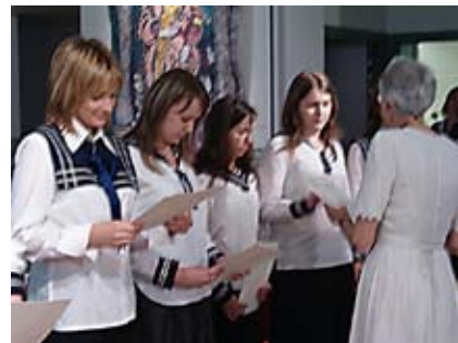
Mádl Dalma asszony átadja a díjakat a diákoknak