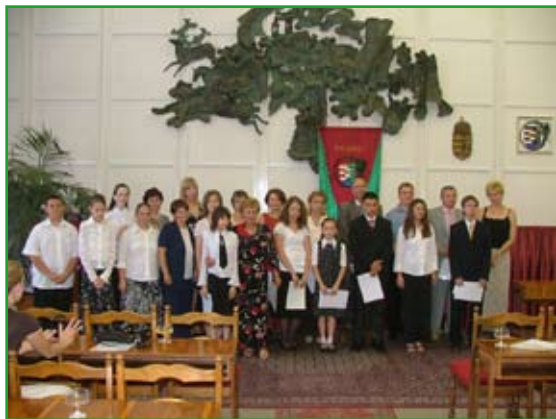
Az elismerésben részesült tanulók és pedagógusok

2007. június 21-én ünnepélyes testületi ülés keretében került sor az elmúlt tanévben kiemelkedő teljesítményt elért diákok és felkészítő nevelőik elismerésére a Városháza nagytermében.