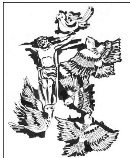
Szabados István: Krisztus madarai

Májusban Sárospatakon, a II. Rákóczi Ferenc Általános Iskolában mutatkozott be, míg május 30-tól június 20-ig Sátoraljaújhelyen, a