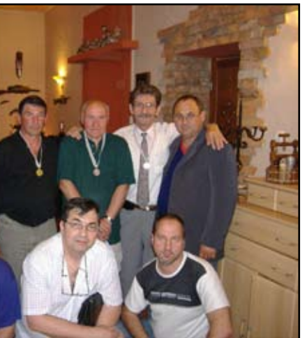
A verseny győzteseinek csoportja

Jelenleg az év végi egy-két napos iskolai kirándulás keretében jönnek a gyerekek, de a tanév vége után többnapos ittlétre is vannak jelentkezők. Az elmúlt