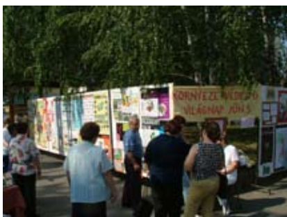
A járókelők közül sokan elgondolkodtak a kiállított alkotásokon

Az 1972-ben Stockholmban rendezett „Ember és bioszféra” című konferencia határozatában június 5-ét nemzetközi környezetvédelmi világnappá nyilvánította.