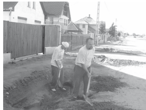
Munkában az utca lakói

Csak így biztosítható, hogy a nagy esők ellenére is járható ma-